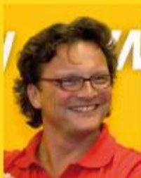
Idee & Projektleitung Mag. Dr. Martin ARNOLD